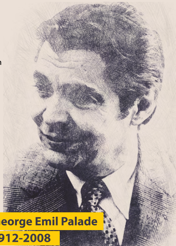
George Emil Palade

S-a stins din viață în 2008, la San Diego, la vârsta de 96 de ani. Cenușa i-a fost împrăștiată de copiii săi, în Masivul Bucegi.